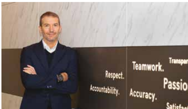
Paolo Pozzi, CEO Agrati Group & EIFI Automotive Group Chairman

Già nel primo incontro del 12 Febbraio 2020, si prendeva atto che l'anno appena trascorso era già il secondo a registrare un calo globale sia nelle vendite (2019 vs 2018 = -4,5%) che nella produzione di veicoli (2019 vs 2018 = -5,8%) e che il 2020 appena iniziato non solo non presentava aspettative di miglioramento del trend (previsione vendite 2020 vs 2019 = -0,7% / produzione -0,2%) ma avrebbe dovuto anche fare i conti con il coronavirus cinese. La previsione di crescita del PIL mondiale nel 2020 era, a quel tempo, del